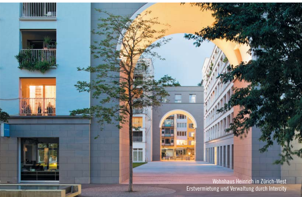
Wohnhaus Heinrich in Zürich-West Erstvermietung und Verwaltung durch Intercity