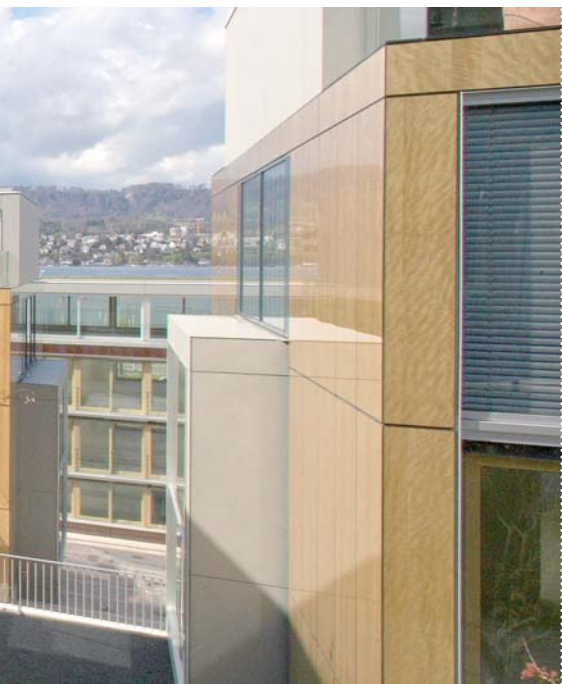
Wohnhaus «Seewürfel» im Zürcher Seefeld Erstvermietung durch SPG Intercity Zurich