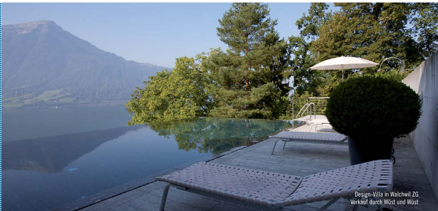
Design-Villa in Walchwil ZG Verkauf durch Wüst und Wüst